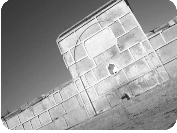
Dobriç'e bağlı Jeglartsı köyündeki eski Osmanlı çesmesi kitabesiyle birlikte hala ihtişamını koruyor.

Dobriç yakınlarında bulunan Jeglartsı köyündeki Derviş Bey mescidi Balkanlar'daki en eski yapı olarak günümüze kadar ulaştı. Türk Tarih Kurumu'nun çalışmaları doğrultusunda Mimar Mehmet Yılmaz, "Bulgaristan Dobriç Camiler ve Çesmeler" konulu master tezinde 1299 yılına ait mescid ile birlikte Dobruca Bölgesi'ndeki 8 cami ve 6 çesmeyi inceledi.