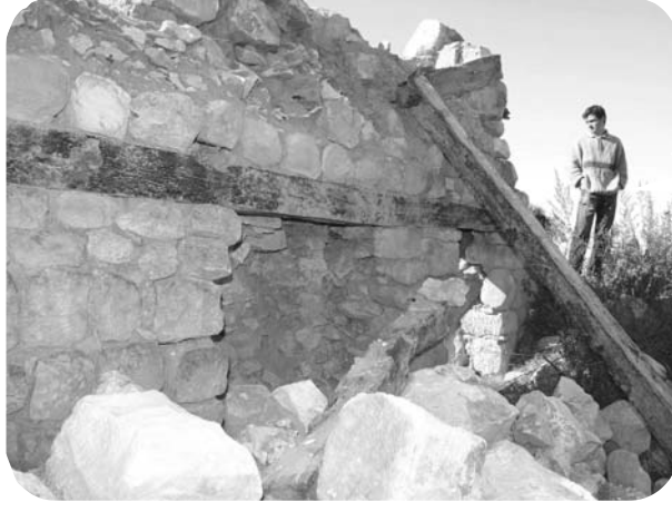
90'lı yılların başlarında yangın sonrası harap olan Derviş Bey mescidi yıkılışın izlerini taşıyor.